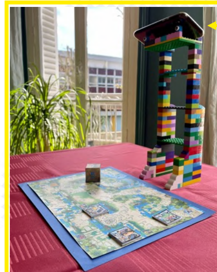
Smartphone « œil du jeu »